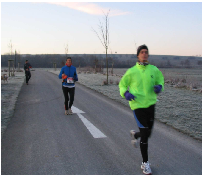
lockeres Einrollen am Seeburger See

Ganz schnell wurde es dämmrig und schon nach ca. 13km sah man "ihn" (so man die Topographie der Region kannte) von der Seulinger Warte aus zum ersten Mal - noch so weit weg, dass es wirklich nicht schwerfiel, nicht daran zu denken, dass man da heute noch hin wollte. Überhaupt: Mein Motto lautete: 12 Stunden in Bewegung bleiben, dann wird man wohl da sein. Also eher nicht: Wie weit ist es noch, sondern wie lange muss ich noch. Hilft irgendwie (und brachte den tollen Effekt, dass es letztlich gar nicht so lange dauerte).